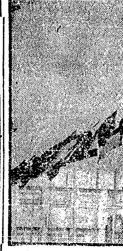
Catorce banderas nacion... en Lisboa donde se cele...